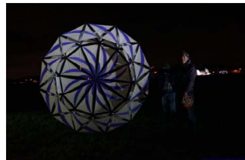
Nachtvliegeren (ring van cassagne)