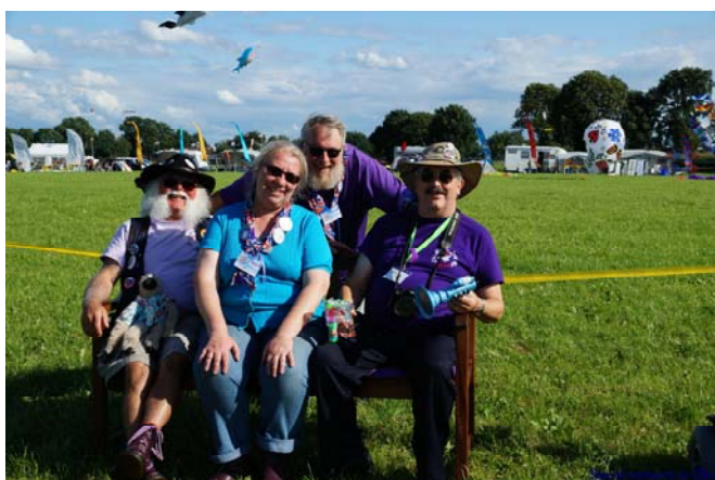
Grumpy Old Gits (Engeland).

En wil je zien wie dit alles gaat bedienen en daar voortreffelijk geluid uit “tovert”, kom dan op zaterdagmiddag kijken bij de Rijsbergse Vliegerdagen !