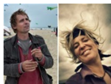
Wad en Wind