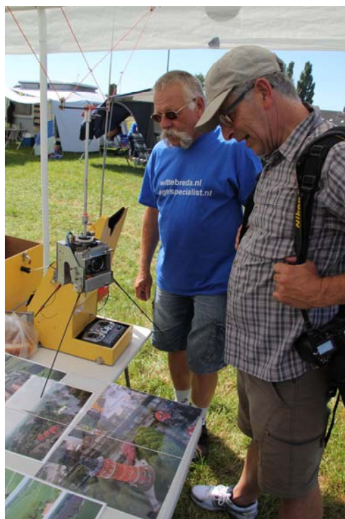
Cees Kuppens : www.vliegerfoto.nl (Foto Erwin Martens)