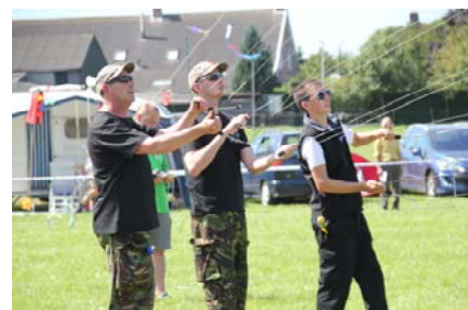
The North East Kite Flyers

Met sportieve groet, Stichting Rijsbergse Vliegerdagen info@rijsbergsevliegerdagen.nl